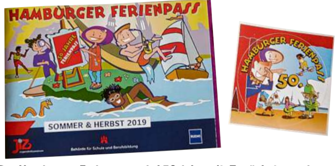
Der Hamburger Ferienpass wird 50 Jahre alt. Zunächst nur eine kleine Klappkarte, heute ein dickes Heft mit tollen Angeboten