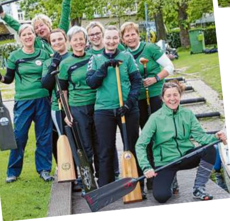
Die Lady Dragons des Alster-Canoe-Clubs sind eine verschworene Gemeinschaft. Im Boot kommt es auf die Feinabstimmung an