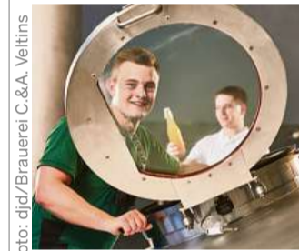
Tradition und Moderne verbindet sich Brauerberuf

Das Besondere an der Tätigkeit des Brauers und Mälzers ist die Arbeit mit verschiedenen, sogar historischen Malzen und die Rückbesinnung auf handwerkliche Brautraditionen in Verbindung mit modernsten Technologien. Das Bedienen und Instandhalten der Maschinen zählt zu den täglichen Arbeitsaufgaben. In der sauerländischen Brauerei C.&A. Veltins durchlaufen Azubis alle Schritte der Bierherstellung und lernen so den traditionellen Brauvorgang von der Pike auf. Seit 2018 bietet Veltins eine Kombination der Ausbildung mit dem dualen Bachelorstudium der Getränketeknologie an. Nach einer 15-monatigen praktischen Ausbildung in der Brauerei beginnt das reguläre Studium an der Hochschule in Geisenheim. (djd)