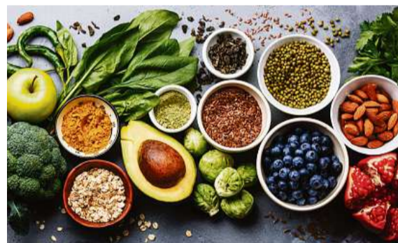
Nüsse, Eier, Gemüse, Getreide sind gesund