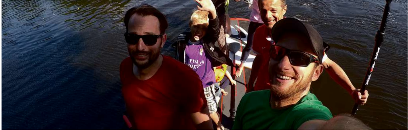
Natur bei einer SUP-Tour erleben, auch das ist möglich am Tag der Stadt-Natur

HAMBURG Die Wanderschuhge schnürt und auf zu Hamburgs größtem Natur-Event: Am Wochenende 15./16. Juni ist „Der Lange Tag der Stadt-Natur“, ein Erlebnis draußen und im Freien mit Führungen durch Hamburgs schönste Grünanlagen, Parks und Naturgebiete. 30 Stunden mit rund 220 Aktivitäten zu Wasser und an Land. 100 Veranstalter werden wieder ein buntes Spektrum für jedes Alter anbieten.