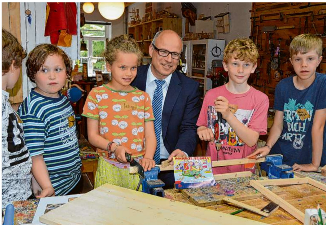
Schulsenator Ties Rabe stellte das aktuelle Ferienprogramm in einer Werkstatt in Altona vor, die mit tollen Angeboten für Kinder beim Programm dabei ist