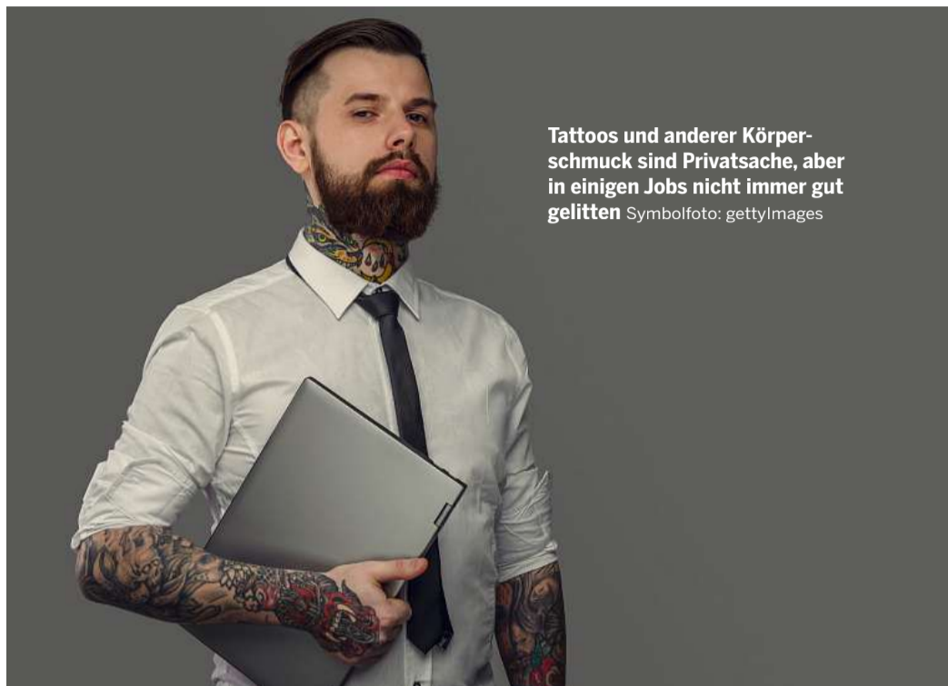
Tattoos und anderer Körperschmuck sind Privatsache, aber in einigen Jobs nicht immer gut gelitten.

Da das aber nicht bei allen im Betrieb gut ankomme und Tattoos zu Ärger führen können, haben die Arbeitnehmervertreter sich des Themas angenommen. „Generell sei ein Tattoo Privatsache. Ebenso Piercings oder ein Tunnel im Ohr läppchen. Auch bei der Gestaltung der Frisur darf sich der Arbeitgeber im Prinzip nicht einmischen“, so die Arbeitsrechtsexperten. Denn jeder habe gemäß Artikel 2 des Grundgesetzes das Recht auf freie Entfaltung der Persönlichkeit. So könne jemand, der mit einem Tattoo eingestellt worden sei, nicht nach ein paar Jahren aufgrund des Körperschmucks gekündigt werden. Aber ganz so einfach ist es eben doch nicht. „Ausnahme bildet die Widerset-