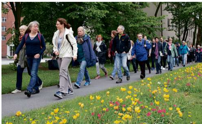
Die Horner Geest ist ein Grünzug, den viele Hamburger gar nicht kennen

HAMBURG Die Wanderschuhge schnürt und auf zu Hamburgs größtem Natur-Event: Am Wochenende 15./16. Juni ist „Der Lange Tag der Stadt-Natur“, ein Erlebnis draußen und im Freien mit Führungen durch Hamburgs schönste Grünanlagen, Parks und Naturgebiete. 30 Stunden mit rund 220 Aktivitäten zu Wasser und an Land. 100 Veranstalter werden wieder ein buntes Spektrum für jedes Alter anbieten.