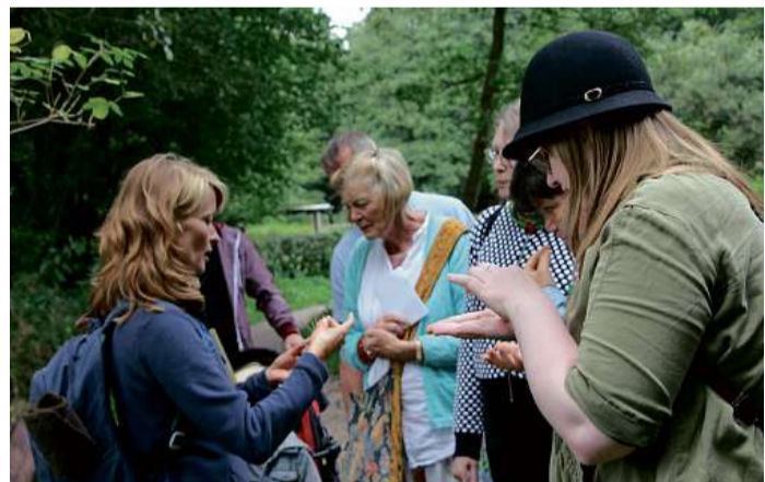
Wildkräuter am Wegesrand sind wichtig für das Überleben der Insekten

Voller spannender Dinge, die es zu entdecken gibt, präsentieren sich die Veranstaltungen für Kinder. Wer möchte nicht einmal in die „Farbtöpfe der Baumhexe“ schauen oder „die Honigbienen besuchen“. Die kleinen Naturdetektive kommen Vielem auf die Spur, was nicht in den Schulbüchern steht und erfahren viele Details über die Natur im Garten oder Park um die Ecke. Natur erleben, dazu bietet der Lange Tag der Stadt-Natur alle Möglichkeiten – in einmaliger Vielfalt.