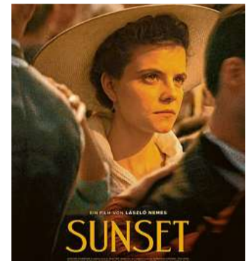
„Sunset“ ist der zweite Film von László Nemes

Ab Donnerstag, 13. Juni im Kino, www.kino.de