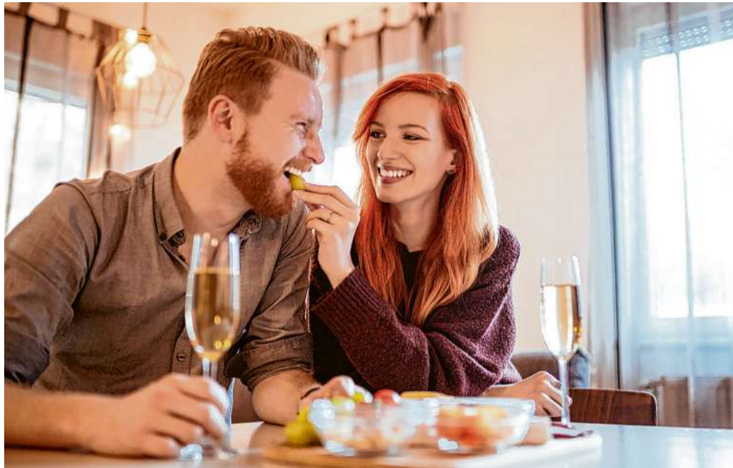
Die Ernährung kann direkten Einfluss auf unser Glücksempfinden haben

Diese LEBENSMITTEL sorgen für gute Laune