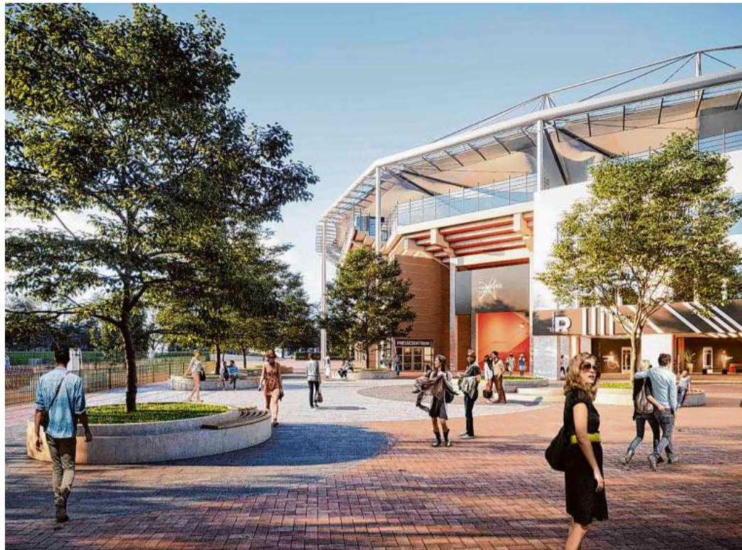
Die Visualisierung zeigt die geplante Umgestaltung des Tenniszentrums